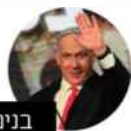
בנימין נתניהו $499