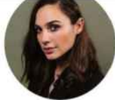
גל גדות $848