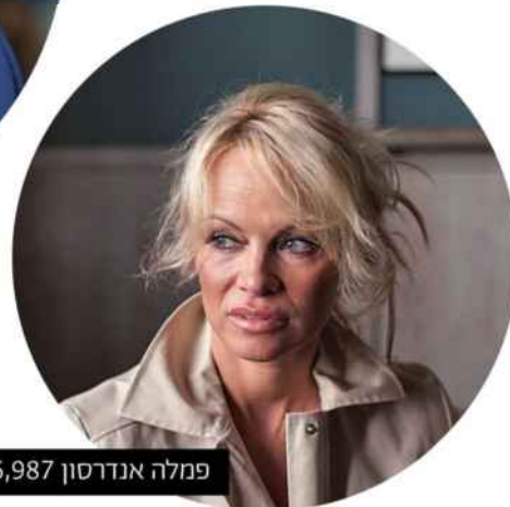
פמלה אנדרסון $6,987