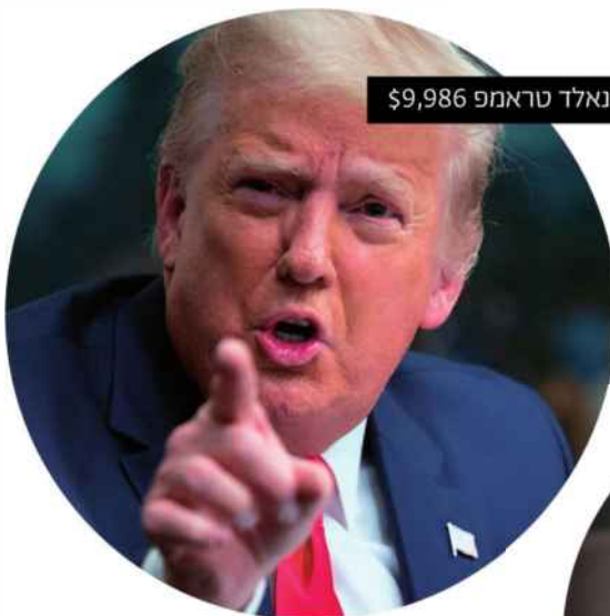
דונאלד טראמפ $9,986

המשתמשים, בינתיים, מוטרדים פחות. ג'וליה (1,153 דולר), מפיקת מוזיקה ממוסקבה, מאמינה שזו הרשת החברתית של העתיד. היא לא השקיעה כסף, אבל כבר רואה שהרשת מביאה לה עוקבים חדשים גם באינסטגרם. "כר" לם מתייחסים לזה כמו אל משחק, ועל יחסים אמיתיים זה לא משפיע בכלל", היא אומרת. "אני מרגישה אחריות אישית לכל המטבעות שלי. זה מצחיק". בלסינה טריאדה (10.14 דולר), מעצבת אופ" נה מבואנוס איירס, הצטרפה כי האמינה שיש כאן הזדמנות לאמנים. בשבילה זו יותר רשת חברתית, וגם קצת משחק, משהו שכדאי לנסות, היא אומרת משיחת וידיאו. עד כה השקיעה 14 דולה. "לא מזמן המטבע שלי עלה ב-6 דולר והייתי כזה... וואה, וואה! והתרגשתי, כי אני קצת ככה, מתרגשת קצת מכל דבר". על העניין של תווית המחיר לא באמת חשבה. "זה כאילו שהמרנו את הלייקים של אינסטגרם במחיה בש" ביילי זה לא מאוד שונה. אבל זה קצת מוזר שזה האישיות שלך שיש לה את הערך ולא העבודה שאתה עושה".