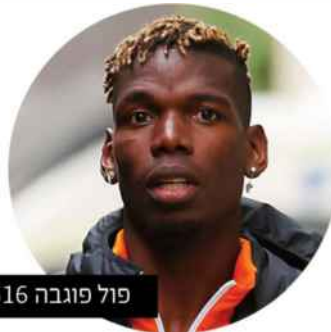
פול פוגבה $3,616