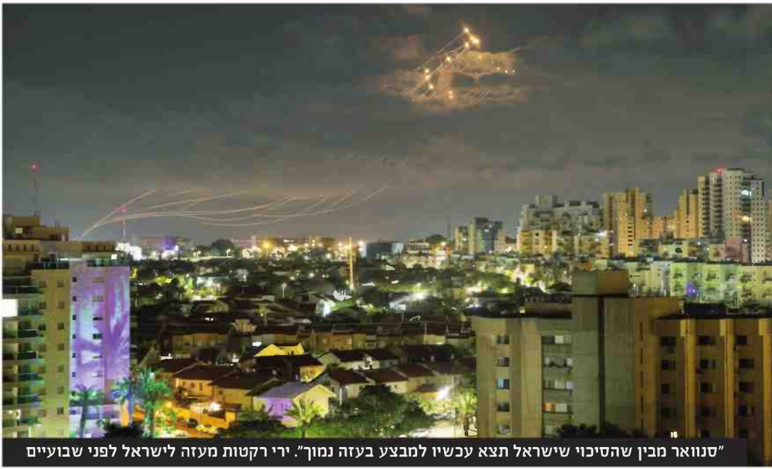
"סנוואר מבין שהסיכוי שישראל תצא עכשיו למבצע בעזה נמוך". ירי רקטות מעזה לישראל לפני שבועיים