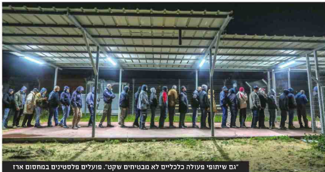
"גם שיתופי פעולה כלכליים לא מבטיחים שקט". פועלים פלסטינים במחסום ארז

"גם כמתווך וגם בקידום חקיקה פרלמנטרית שתחייב לימוד ערבית מדוברת בבתי הספר הממלכתיים במקום