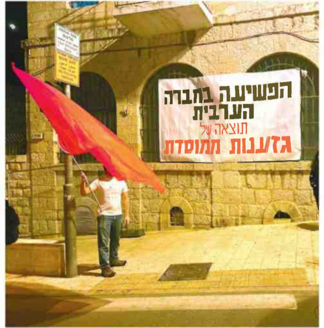
הפגנות בחברה הערבית במחאה על האלימות ומחדלי הממשלה בטיפול בה. התוכנית מובטחת כבר שנים