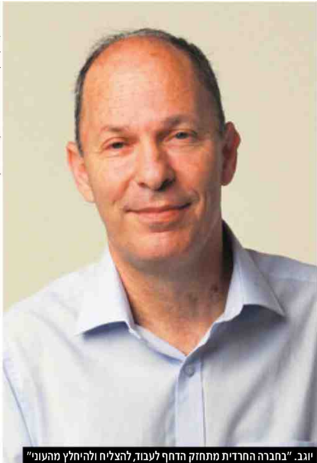
יוגב. "בחברה החרדית מתחזק הדחף לעבוד, להצליח ולהיחלץ מהעוני"