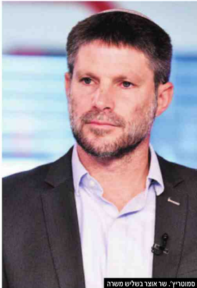
סמוטריץ'. שר אוצר בשליש משרה